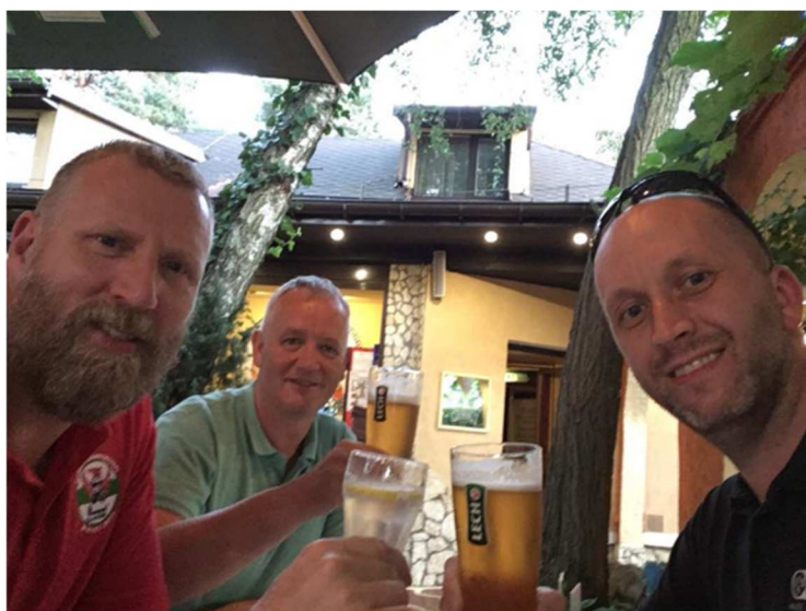
Gezellig bij de Griek in Zawiercie.