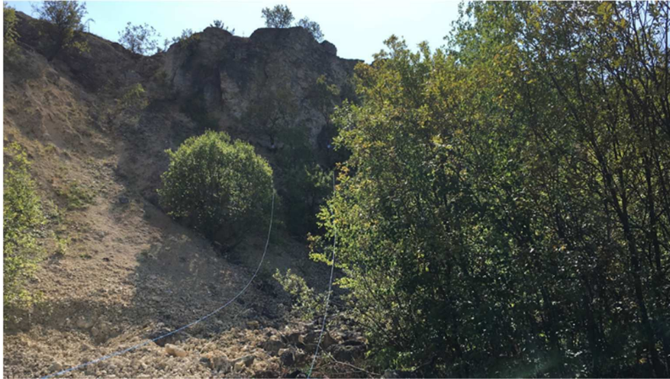
Een stukje van het parcours

De tweede wedstrijddag moest de middag groep van dag 1 beginnen met waar ze de dag ervoor gebleven waren, en dan nog een volledig parcours schieten. Hierdoor wisten wij al dat we ook problemen zouden krijgen met tijd en daglicht 's middags. We begonnen om 14.00 uur en waren ruim een uur onderweg toen een ware onweersstorm uitbarstte, zware regen en diverse blikseminslagen vlakbij. Na een half uur twijfelen door de Poolse wedstrijdleiding nam de president van het WFTF, de Portugees Sergio Rita, de beslissing de wedstrijd direct te staken. Eigenlijk een geluk bij een ongeluk. Als we namelijk hadden moeten doorgaan, was de wedstrijd voor het einde gestaakt vanwege wegvallen van het daglicht. Niet iedereen was er blij mee, maar het wegvallen van 1 wedstrijddag zorgde ervoor dat daarna alles volgens planning door kon gaan. Het is dus een WK over 100 schoten geworden i.p.v. 150.