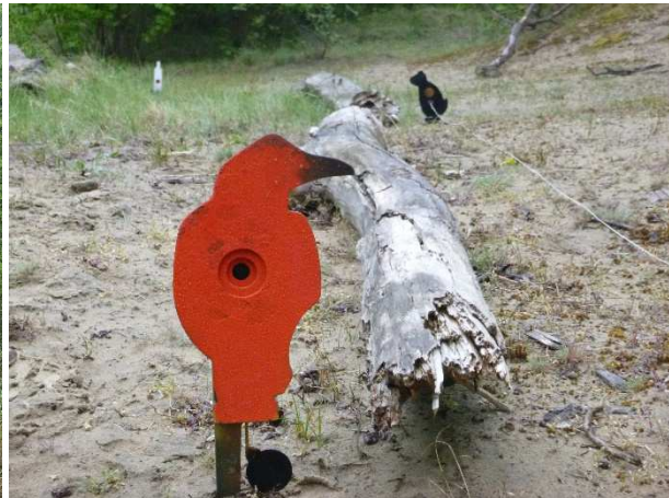
Om het lastig te maken, hebben we doeltje in drie verschillende kleuren meegenomen.

Als iedereen zo'n beetje doorweekt is, is het tijd voor koffie, soep en uitsmijters. Dat geeft meteen de gelegenheid om eens met elkaar van gedachten te wisselen over het organiseren van een wedstrijd hier. Want zowel Oranje Nassau als de DFTA hebben daar wel oren naar. We leggen uit dat de DFTA, speciaal voor verenigingen die willen starten met FT en HFT schieten, doeltjes en loodopvangkratten heeft, die een vereniging zonder kosten voor de duur van een jaar kan lenen.