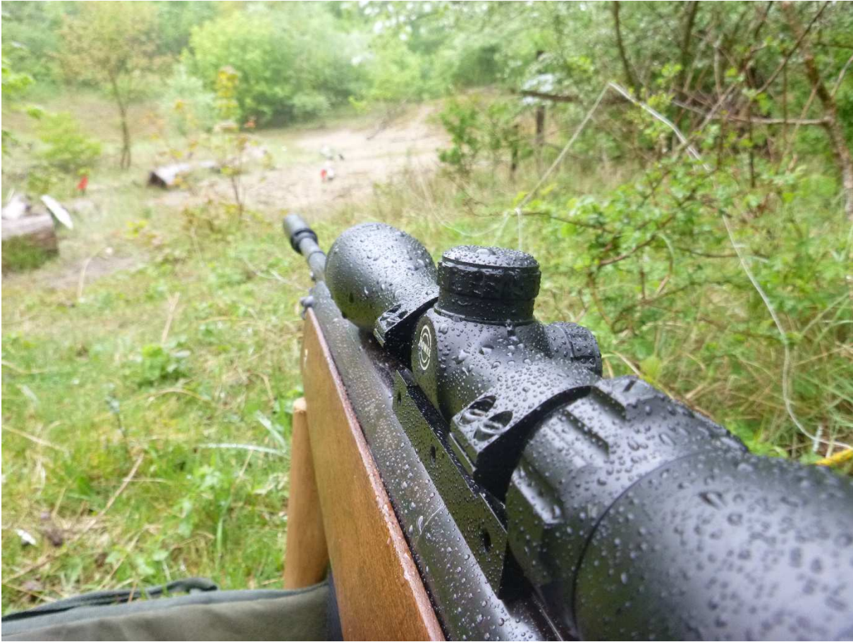
Een best wel natte HW80.

Ook de andere leden krijgen nu één voor één een buks in handen. En al snel heeft eigenlijk niemand meer erg in de regen, maar is iedereen erop gespist die doeltjes om te schieten. Een buks weer uit handen geven? Echt niet! Alleen als ik daarna die andere een keer mag proberen, hoor!