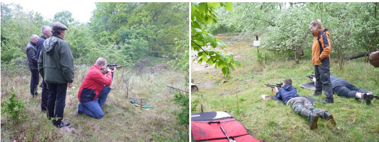
Knielende en liggende houding.